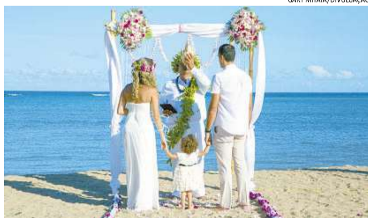
Casal recebe as bênçãos nas areias quentes do Havaí